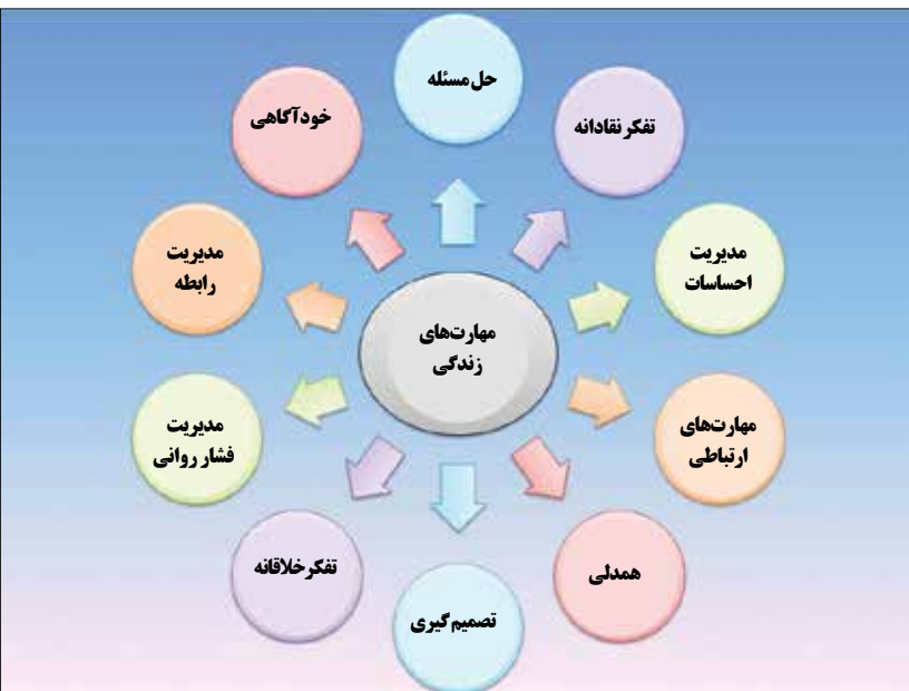
مهارت‌های زندگی.